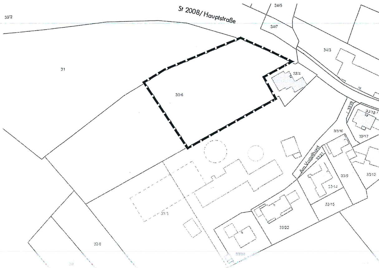
Abbildung 1: Lageplan des Geltungsbereiches des BBP Nr. 8 "GE am Vogelherd", unmaßstäblich